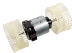
febi 43775 Ventilador do habitáculo com motor aplicações Actros II+III Referência OE 003 830 05 08

Podem ocorrer avarias durante o funcionamento do ventilador interior, mesmo que a própria resistência em série não esteja defeituosa. Outros componentes elétricos, tais como interruptores, cabos ou o próprio motor do ventilador podem ser a causa. Por esta razão, a febi oferece não só a resistência do ventilador para os veículos Mercedes-Benz Actros II + III, mas também os respetivos ventiladores do habitáculo febi 43775 e febi 104768, dependendo da configuração do veículo.