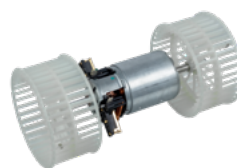
febi 104768 Ventilador do habitáculo com motor aplicações Actros II+III Reeferência OE 002 830 84 08

Para mais informação, visite: partsfinder.bilsteingroup.com