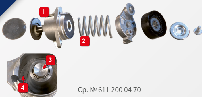
Ср. № 611 200 04 70

Износостойкая пластмассовая втулка (5) отделяет пружину от дна корпуса и предотвращает металлический контакт в области крепления. Поскольку речь идет о параметрах скручивания пружины, высота пружины была уменьшена (6). Контакт пружины с дном корпуса эффективно предотвращается также посредством упора пружины в пластмассовую втулку (7). Таким образом не возникают никакие шумы. В новом варианте (8) стальной стержень, на котором центрируется пружина, выполняется литым.