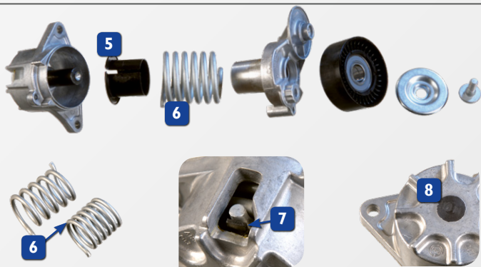
SWAG № 10 92 6775 Ср. № 646 200 05 70

Больше технической информации Вы можете найти в он-лайн каталоге: partsfinder.bilsteingroup.com