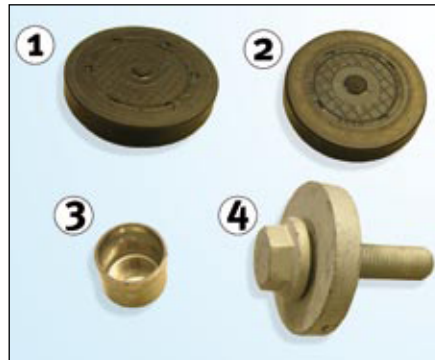
Fot. 1: Zawartość zestawu

Podczas wymiany podanych zestawów SET i KIT, konieczna jest również wymiana elementów pokazanych na fot. 1. Schaeffler Automotive Aftermarket dołącza je do podanych zestawów.