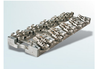
Kuva 2: Keinuviivun laakerin teline 423 0063 10

Citroën, Fiat, Ford, Land Rover ja Peugeot -autojen valmistajat käyttävät nykyisin uusia Euro 4 päästönormin täyttäviä dieselmootoreita.