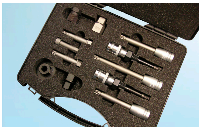
Рисунок 3: Специнструмент INA 400 0241 10 400 0241 10

Для замены шкива генератора с обгонной муфтой требуется специнструмент, показанный (на рис. 3).