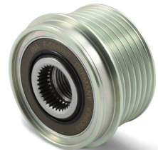
Figur 2: ny utforming