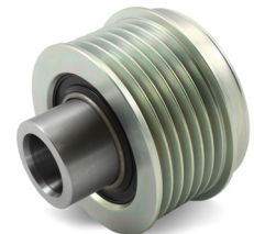
Figur 4: ny utforming

Som en del av den kontinuerlige utviklingen av våre produkter, har det blitt gjort endringer til friløpremskiven OAP med delnr. 535 0233 10.