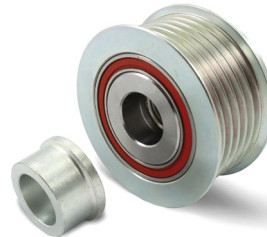
Figur 3: tidligere utforming