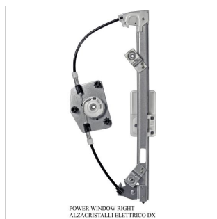
POWER WINDOW RIGHT ALZACRISTALLI ELETTRICO DX

Lève-vitre de remplacement / Ersatz-Fensterheber Alzacristalli di ricambio / Elevavinas de recambio