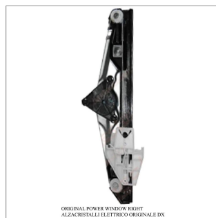
ORIGINAL POWER WINDOW RIGHT ALZACRISTALLI ELETTRICO ORIGINALE DX

Lève-vitre d'origine / Original-Fensterheber Alzacristalli originale / Elevavinas original