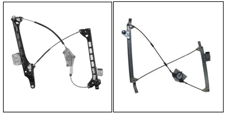
Elevavinas original – lève-vitre original – oem window regulator – levandator de vidro original