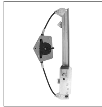
Nuestro elevavinas – notre lève-vitre – our window regulator – nosso levantador de vidro