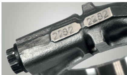
Numere de împerechere

Pentru a evita confuziile, tijele bielelor și capacele de lagăr aferente sunt marcate de regulă cu numere de împerechere identice.