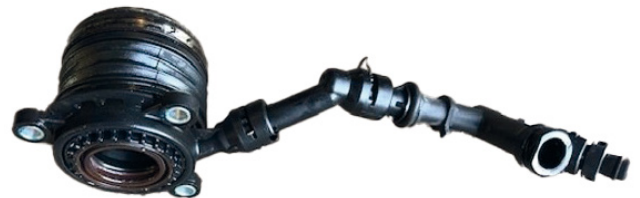
Figura 1: linea idraulica del CSC in plastica

Un attuatore concentrico in plastica difettoso (fig. 1) non può essere sostituito con la versione in metallo corrente (510 0183 10) senza una nuova linea di collegamento idraulica. In questo caso, è necessario utilizzare la linea idraulica in metallo e varie parti di guida e di collegamento del produttore del veicolo (fig. 2).