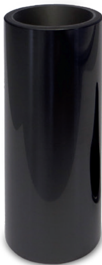
Fig. 1: Pino de pistão com revestimento de DLC

A camada de DLC é aplicada através de um processo PVD (Physical Vapor Deposition). Na construção de motores, o processo PVD é utilizado há mais de 20 anos no revestimento de bronzinas sputter.